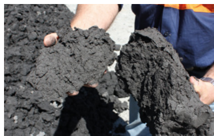
Обезвоженный шлам, получаемый в декантерных центрифугах Альфа Лаваль, имеет достаточно высокую сухость для размещения в виде сухих отходов

Во многих случаях вы сможете увеличить рентабельность производства либо просто за счет установки декантерных центрифуг Альфа Лаваль в дополнение к традиционным сепарационным системам типа сгустителей, отстойников и фильтров, либо заменив полностью все старые системы.